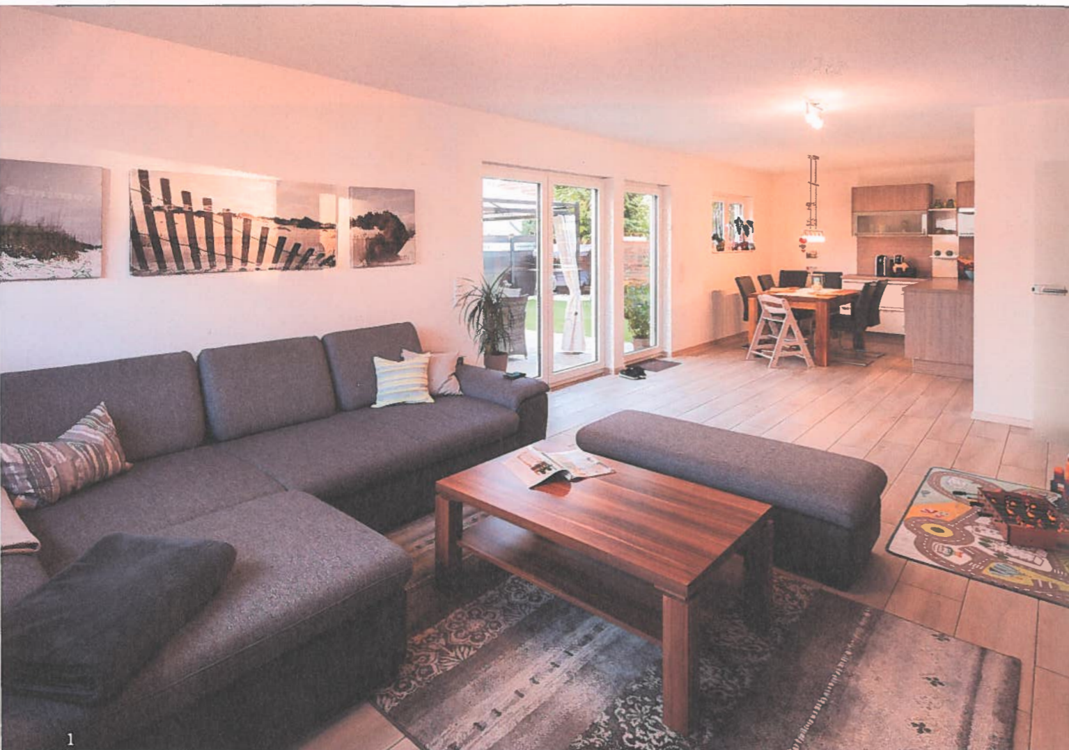
1 Wohnbereich, Essplatz und Küche sind offen angelegt, aber dennoch klar zониert. Helle freundliche Farben geben den Ton an, große Fensterflächen setzen die Szenerie ins richtige Licht. 2 Das Bad bietet einen vor Blicken geschützten Bereich für die Badewanne 3 Im bunten Kinderzimmer darf gerne auch getobt werden 4 Beim Kochen an der Kochhalbinsel reißt der Kontakt zum Esstisch nicht ab.

bei Massivhäusern nach dem Bau oft noch die Maße etwas verändern. Aber bei Fingerhaus waren 2,54 Meter wirklich 2,54 Meter und die Küche hat perfekt gepasst“, freut sich Stefan Kornelius. Von Gästen bekommt heute vor allem die große frei stehende Kochinsel viel Aufmerksamkeit.