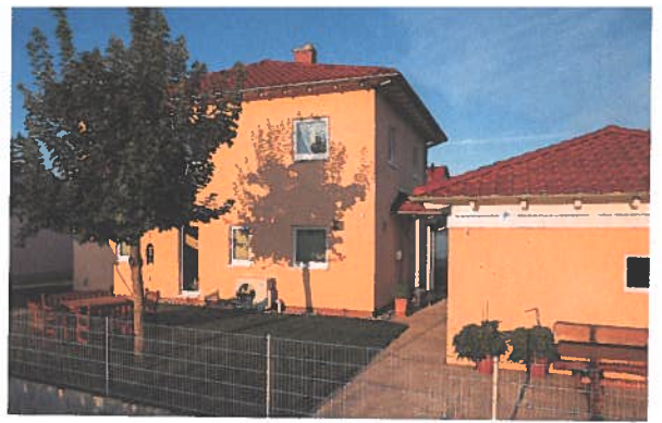
Die Doppelgarage steht separat neben dem Haus.