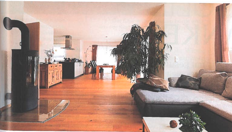
Den großen Familienwohnbereich mit offener Küche wünschte sich die Bauherrin.