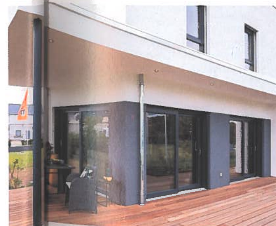
Die überdachte Terrasse ist über mehrere Zugänge erreichbar.

Als förderfähiges „Effizienzhaus 40 Plus“ ist das Haus mit einer Photovoltaik-Anlage auf dem Dach ausgestattet, welche Strom für die elektrische Wärmepumpen-Heizung liefert. Überschüsse werden in einen Batteriespeicher eingespeist, sodass die Bewohner auch abends und nachts selbst erzeugten Sonnenstrom nutzen können. Für ein intelligentes Energie-Management, die Anlagenüberwachung und Steuerung des Batteriesystems sorgt der „Sunny Home Manager“ von SMA. Ein angenehmes Raumklima versprechen eine Fußbodenheizung und eine Lüftungsanlage mit Wärmerückgewinnung, sowie eine hoch gedämmte, vorgefertigte Holz-Fertigbau-Konstruktion, die Wärmeverluste auf ein Minimum reduziert.