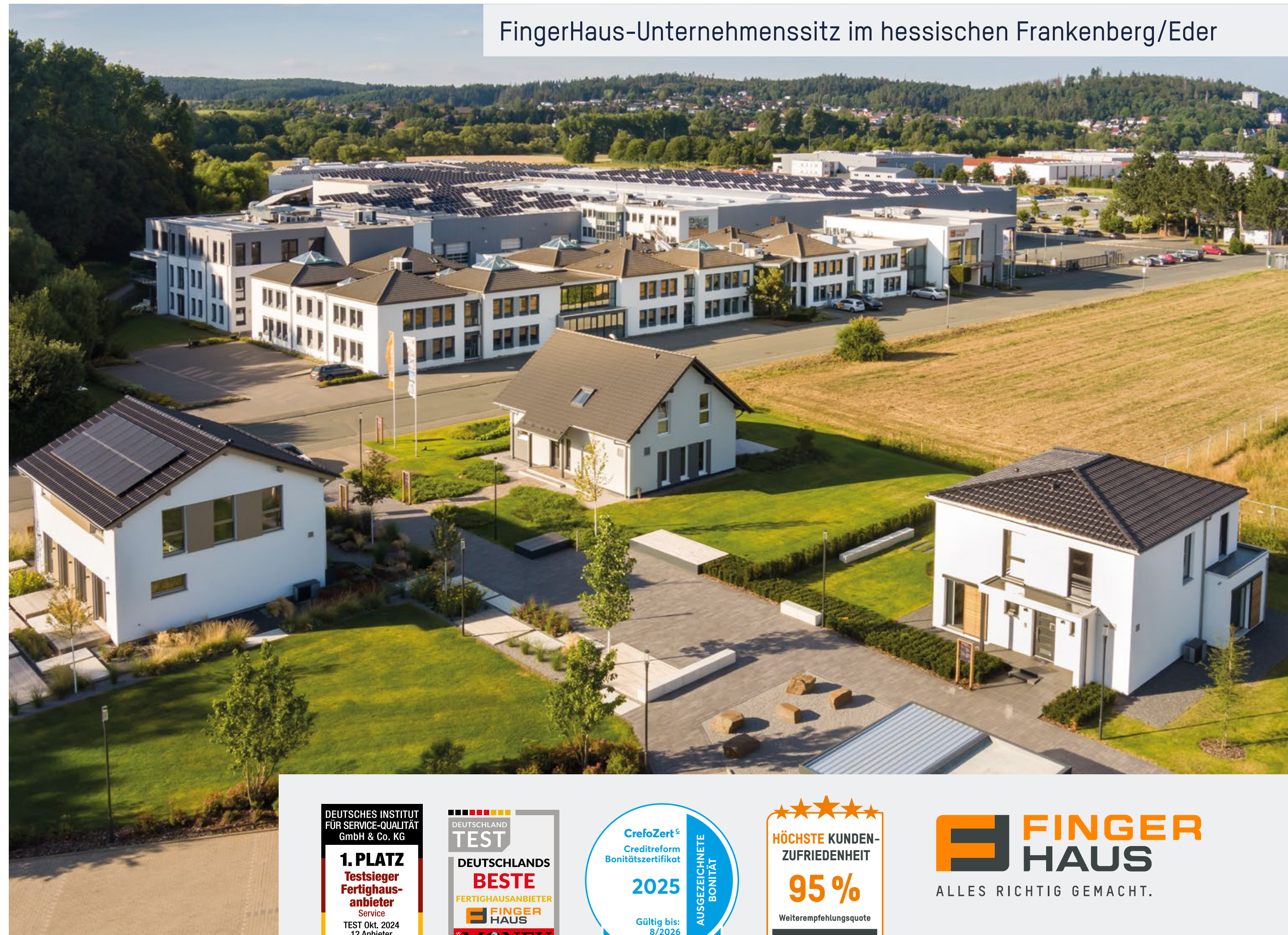
FingerHaus-Unternehmenssitz im hessischen Frankenberg/Eder