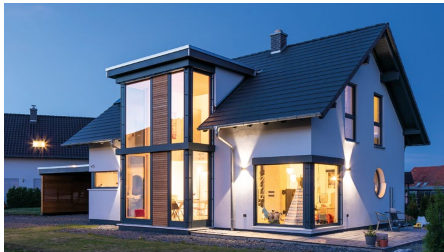
Seite 7: Ihr Architektenhaus