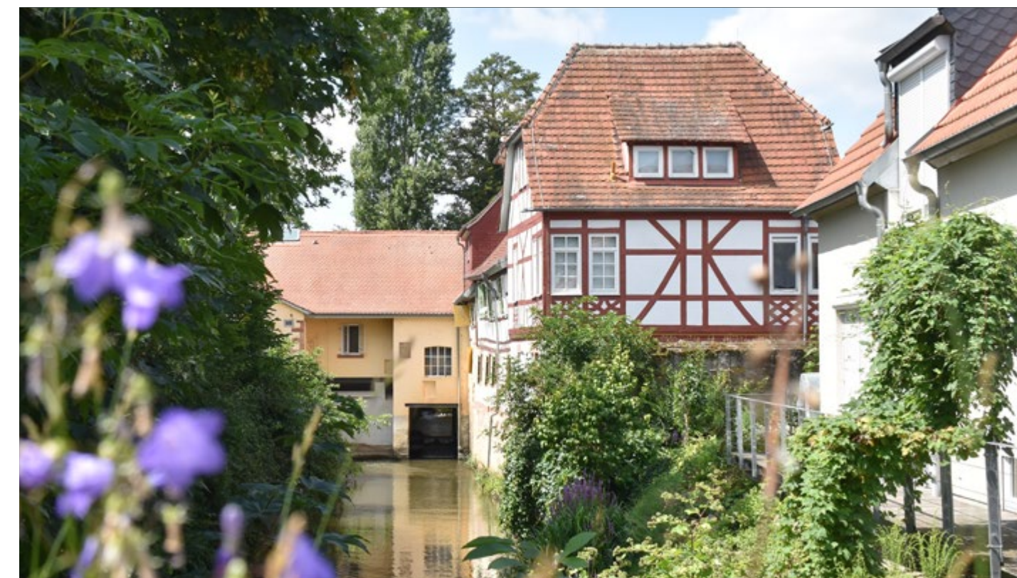
Seite 13: Familienglück in Babenhausen