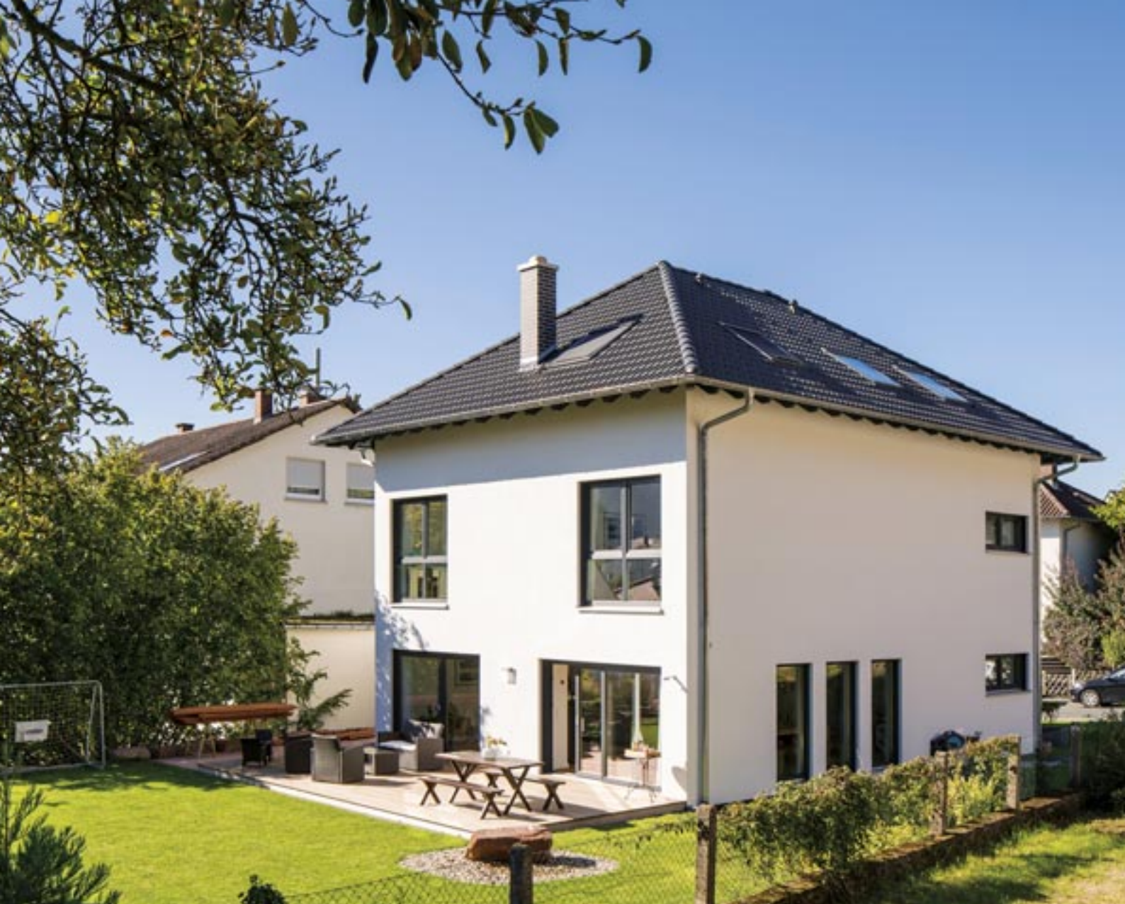
Die eigentlich Größe des Baukörpers offenbart sich erst von der Seite. Die drei Nordfenster dort belichten den Essplatz.