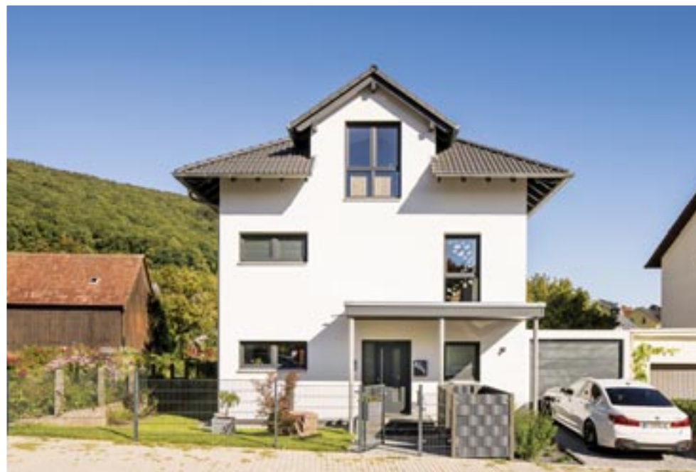
Die Schmalseite wirkt eher bescheiden dimensioniert. Der Zwerchgiebel schafft auch unterm Dach ansehnlichen Wohnraum.