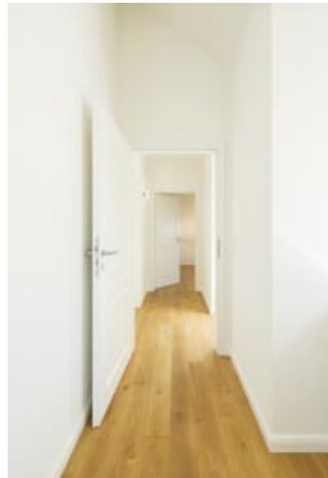
Viel Kopffreiheit herrscht im Dachgeschoss dank firsthohem Ausbau.