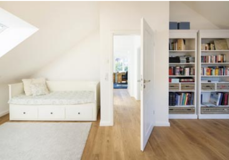
Großzügiges Wohnen auch unterm Dach: Blick vom Gästezimmer zum Quergiebel des Arbeitszimmers. Dazwischen: das Gästebad.