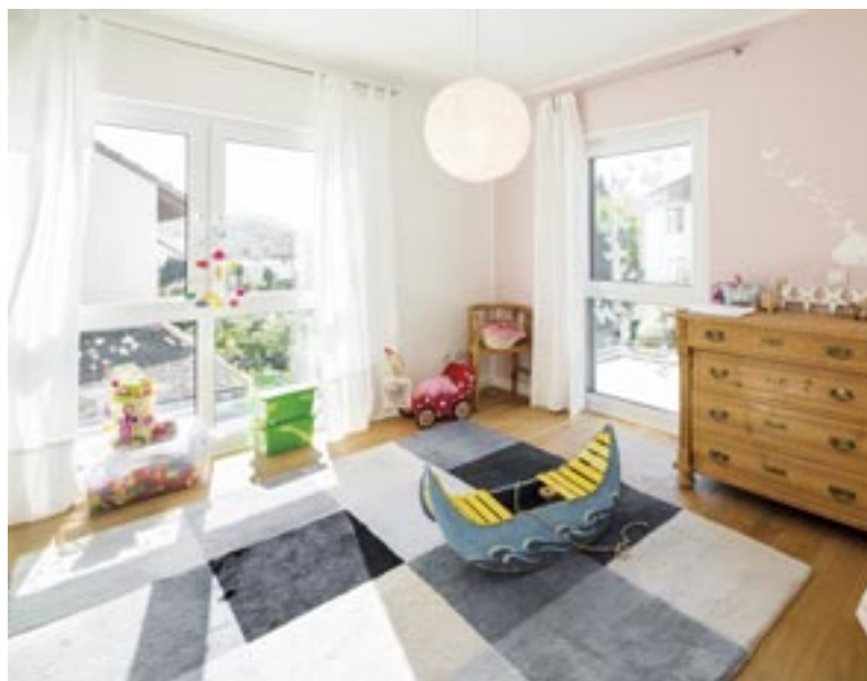
Kinder brauchen viel Licht. Daher haben beide Kinderzimmer Fenster in zwei Richtungen.