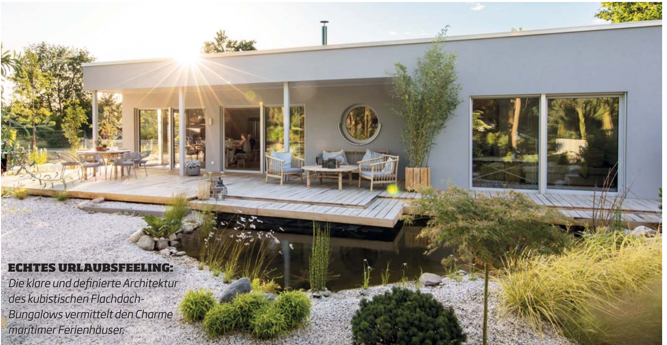
ECHTES URLAUSFEELING: Die klare und definierte Architektur des kubistischen Flachdach-Bungalows vermittelt den Charme maritimer Ferienhäuser.