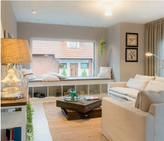
Die Sitzbank, die sich über die gesamte Fensterbreite zieht, eignet sich bestens zum Relaxen oder Lesen.

Von der Haustür blicken Besucher über die Diele ins Wohn- und Esszimmer. Die Diele leitet direkt in den Wohnbereich über. Im Übergang dieser beiden Bereiche erhebt sich die geradeläufige Treppe ins Dachgeschoss. Links von der Diele geht ein geräumiges Gästezimmer ab, das sich auch als Homeoffice nutzen lässt. Rechts liegen das Gäste-WC und der Technikraum.